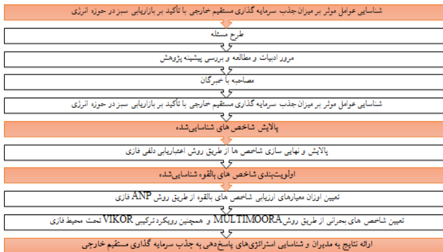
شکل ۱. ساختار کیفی روش تحقیق مسئله پیشنهادی (آکوا و همکاران ۱ ، ۲۰۲۱)

در بخش کمی روش کار بدین صورت است که در ابتدا تمامی پارامترها و معیارهای تأثیرگذار در اتخاذ تصمیم مناسب شناسایی می‌شود. سپس مطابق با هدف اصلی تحقیق، متغیرهایی جهت نشان دادن حالت و مقدار تصمیمات بهینه در نظر گرفته می‌شود. اما در هر مسئله بهینه‌سازی، محدودیت‌هایی نیز وجود خواهد داشت. از طریق پارامترها و متغیرهای ارائه شده، سعی می‌شود محدودیت‌های موجود به شکل معادلات ریاضی طراحی شود. اما هدف اصلی تحقیق نیز به عنوان یک معادله ریاضی اصلی تعریف و به عنوان تابع هدف مسئله شناخته می‌شود. بنابراین، با توجه به تابع هدف و محدودیت‌های طراحی شده، مدل ریاضی مسئله شکل خواهد گرفت. سپس از طریق نرم‌افزارهای موجود به منظور حل مدل‌های ریاضی، با توجه به پارامترهایی که در نظر گرفته خواهد شد، مسئله مورد نظر حل شده و ساختار نهایی تصمیمات ارائه خواهد شد. با توجه به استفاده از ماهیت ریاضی موجود در روش حل، این تضمین وجود خواهد داشت که تصمیماتی که ارائه خواهد شد، تصمیمات بهینه خواهند بود.