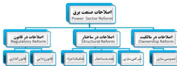
شکل ۱. ارکان و مؤلفه‌های اصلی اصلاحات صنعت برق

صنعت برق در ابتدا با احداث واحدهای کوچک و خصوصی تولید برق حیات خود را آغاز کرد اما به تدریج و با درک اهمیت آن، روند دولتی شدن (و به دنبال آن انحصاری شدن) صنعت مذکور آغاز شد. بدین ترتیب، این صنعت به عنوان یک صنعت یکپارچه و کاملاً انحصاری در اذهان شکل گرفت که هر کسی توان ورود به این عرصه و انجام فعالیت در آن را نداشت. با همین ذهنیت بود که دولت‌ها (به‌طور عام) کنترل صنعت برق را در دست گرفتند. ۲ اما از آغاز دهه ۱۹۹۰، صنعت برق در سراسر دنیا تحولات بنیادینی را تجربه کرد. ساختار سنتی این صنعت که حول انحصار و مالکیت دولتی بنا شده بود، به تدریج منسوخ گشته و زمینه برای رقابت بخش‌های گوناگون با یکدیگر فراهم گردید. ۳ مجموعه اقداماتی که به منظور بهبود وضعیت صنعت برق و ارائه بهتر و مناسب‌تر خدمات به مصرف‌کنندگان صورت می‌گیرد، فرایند اصلاحات صنعت برق نامیده می‌شود. «اصلاحات در مالکیت» ۴ ، «اصلاحات در قانون» ۵ و «اصلاحات در ساختار» ۶ سه بستر مهم اصلاحات صنایع برق هستند که ارکان اصلی این فرایند را تشکیل می‌دهند. ۷ شکل ۱ به خوبی این موضوع را به تصویر می‌کشد.